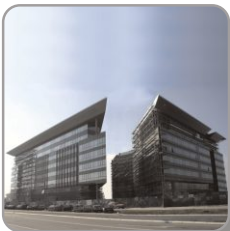
GRAWE Osiguranje, Novi Beograd

Dramin d.o.o. ne snosi odgovornost za probleme, posledice ili eventualnu štetu, koji nastanu korišćenjem sadržaja fotografija ili zbog štamparskih grešaka na dokumentu.